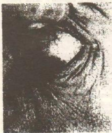
影图 5 分支较多

Патологические проявления Цзан-Фу органов на глазах :(изменение мелких сосудов конъюнктивы (коллатерали), изменение цвета глаз (коллатерали))