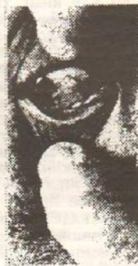
影图 6 隆起一条 (1)